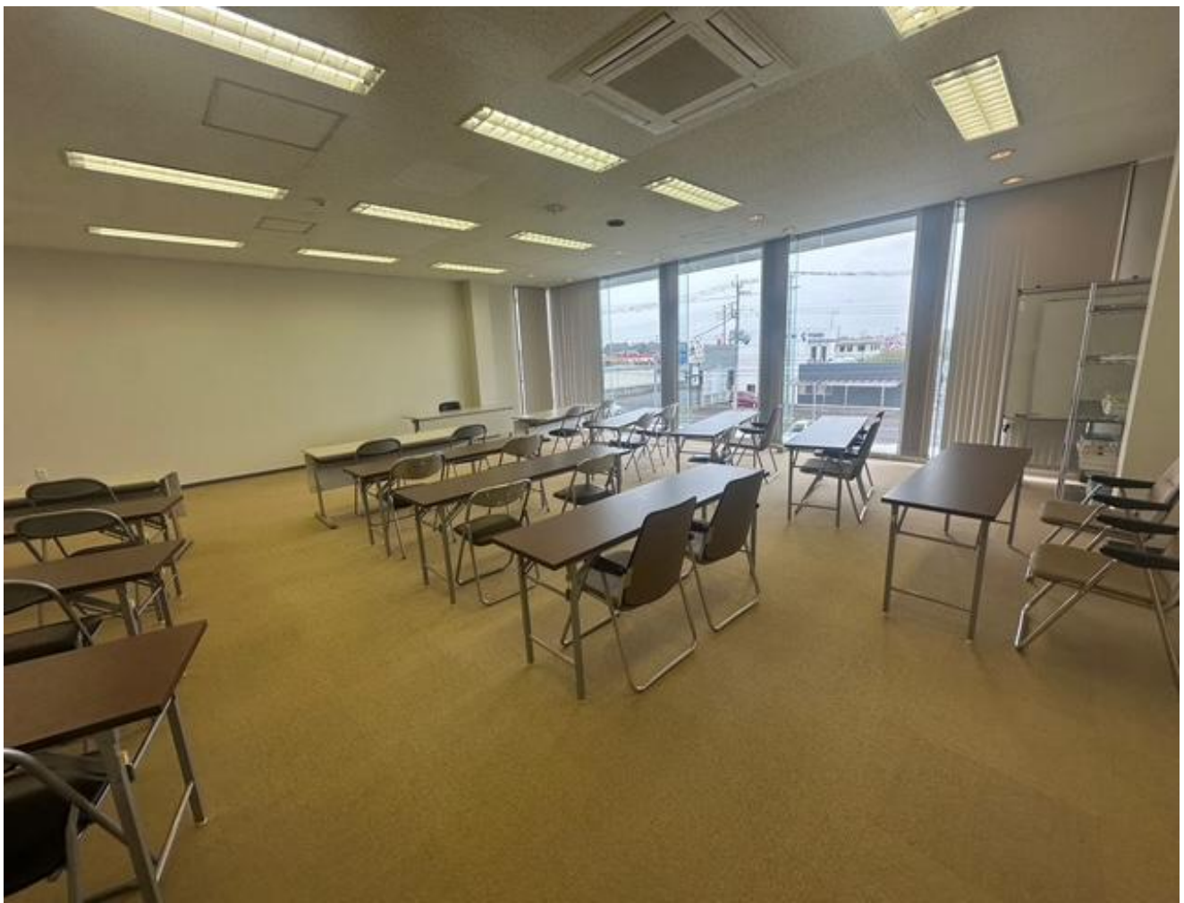
2階 会議室 約70㎡