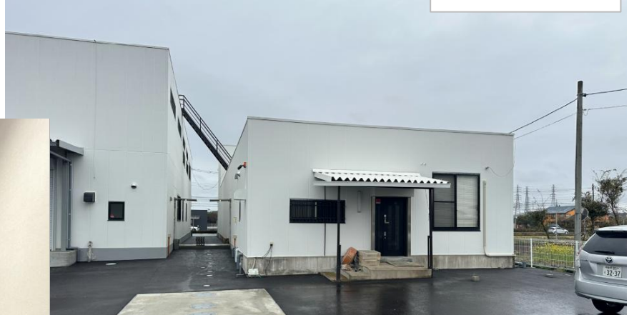
裏側（南）の駐車場から見た玄関

道路側（北）から見た外観 右の建屋が 「(株)ミツキヤ」オーナーさん の駐車場・玄関は裏手になります