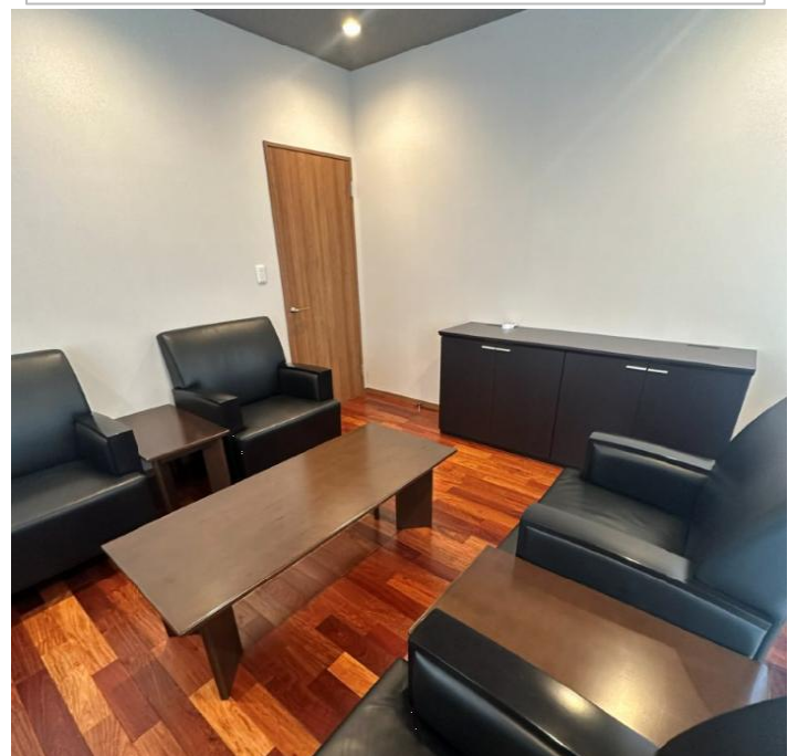
ミツキヤさんが用意してくれた応接室（共用）